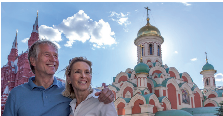
Moskau. Roter Platz

Bitte beachten Sie, dass wir aus zeitlichen Gründen bei einem Ganztagesausflug oder zwei Ausflügen an einem Tag teilweise statt dem Mittagessen an Bord gleichwertige Lunchpakete reichen, um einen optimalen Ablauf gewährleisten zu können!